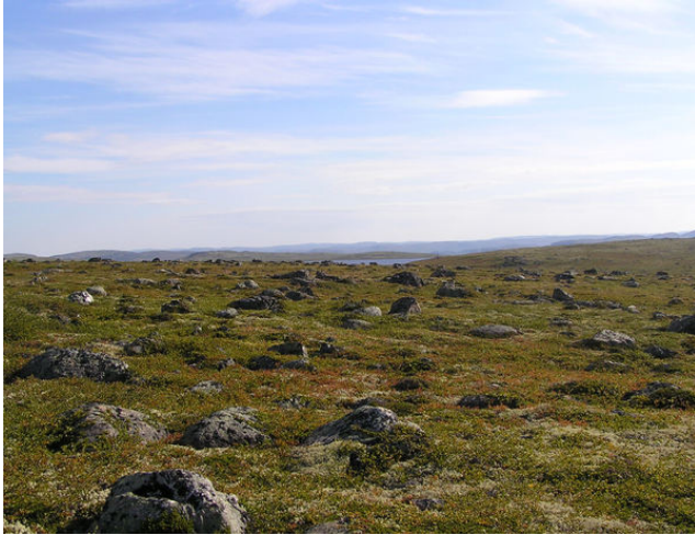
Почва: Тундровая глеевая мерзлотная