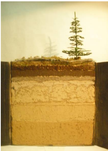
Рис. 2. Экосистема елового леса