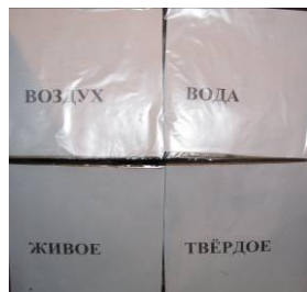
Рис. 3а. Дверцы потайных кладовых