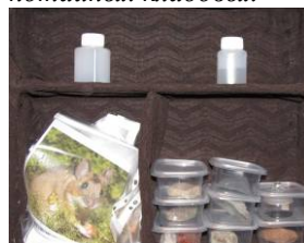
Рис. 3б. Дверцы раскрываются